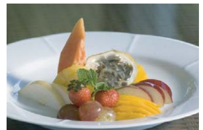
シナモンロッジのレストランのデザート（フルーツ盛り合わせ）