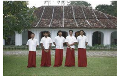
英国人の邸宅だったプチホテルキャンデーハウスの正面とスタッフ