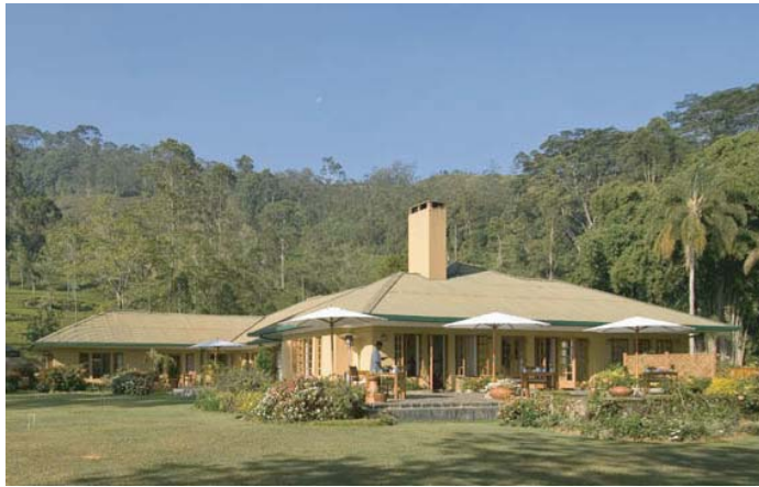
セイロンテイトレイルのノーウッドバンガロウの全景