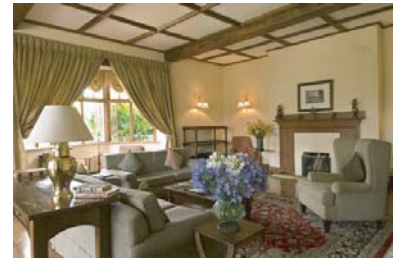
セイロンテイトレイルのテイエンシエンバンガロウのリビング