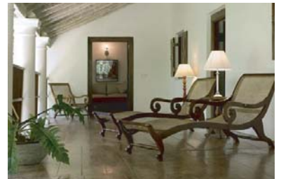
キャンデーハウスのベランダ