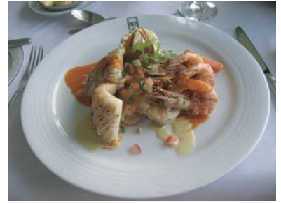
カンドラマホテルでのアラカルトランチ（シーフードプレート）