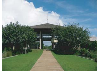
エレファントコリドールホテルの玄関。階上はレストラン 速くにシギアロックを望むことが出来ます。